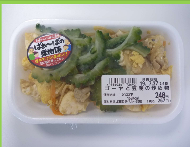
ゴーヤと豆腐の炒め物 140g/248円 豆腐にも醤油ベースのしっかりとした味付け