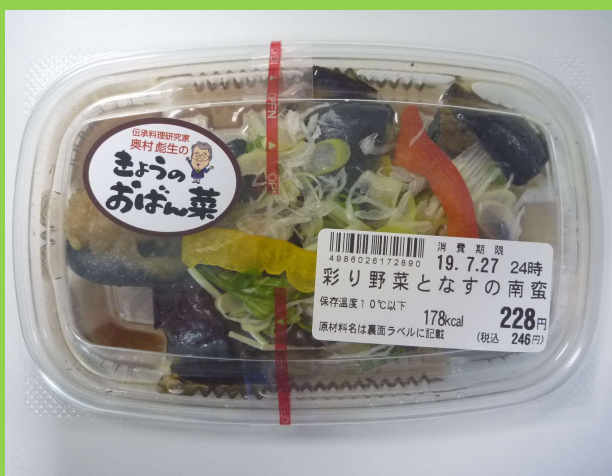
彩り野菜となすの南蛮 130g/228円