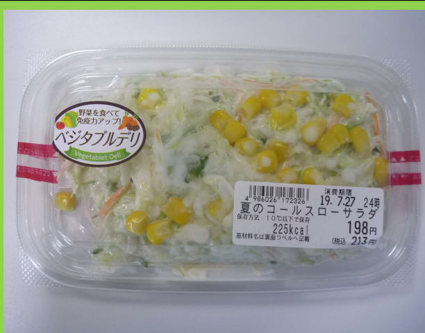
夏のコールスローサラダ 180g/198円 レモン等の柑橘類の効いたサッパリサラダ