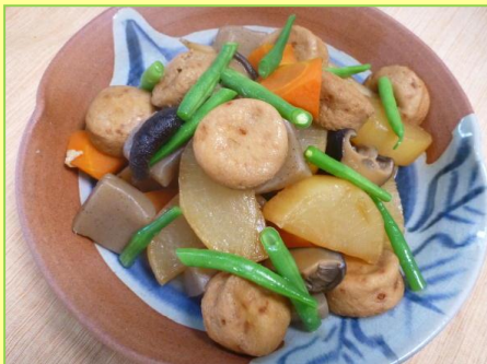
大きめカットでボリューム感アップ