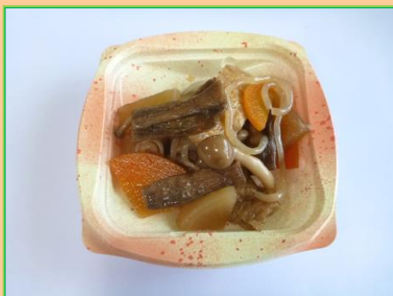
間もなく販売再開します