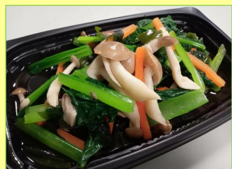
季節感のあるお浸し