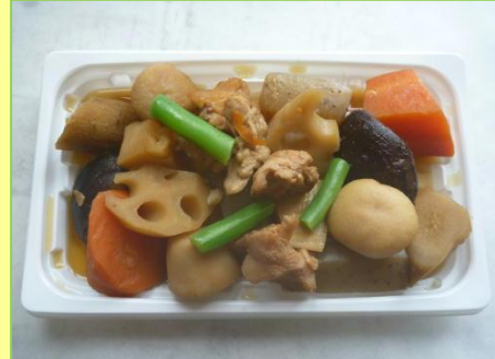
季節感の出る里芋使用